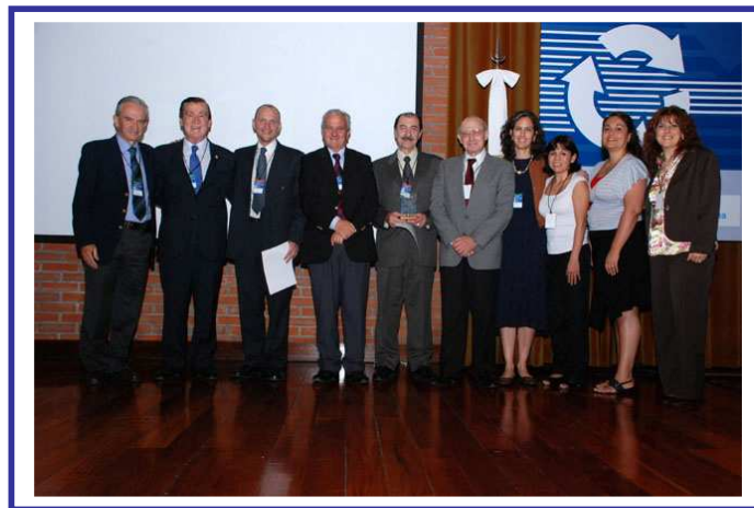
Comisión Directiva del IAPC recibiendo diploma y premio de reconocimiento con motivo del 50º aniversario de la institución.